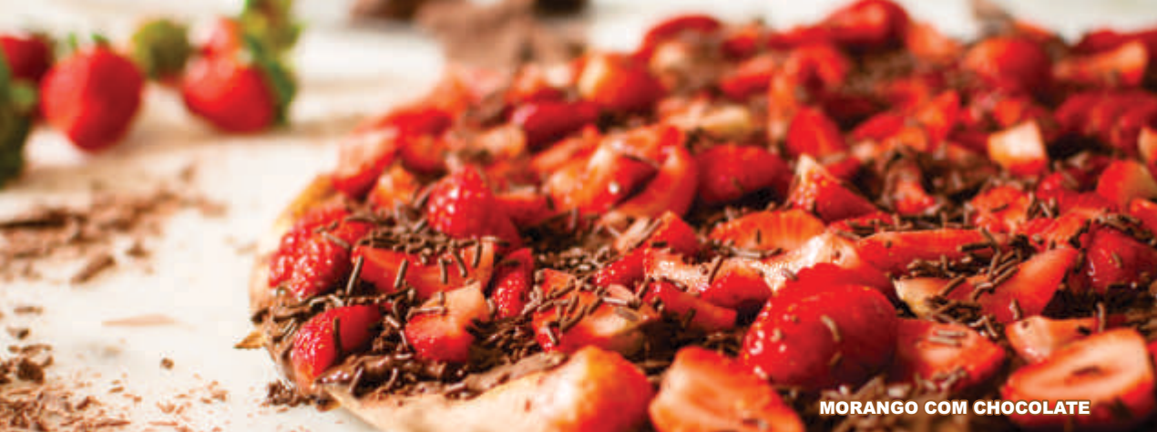
MORANGO COM CHOCOLATE